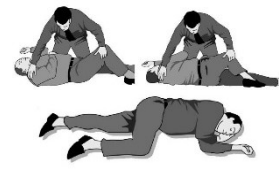
POSICIÓ DE SEGURETAT