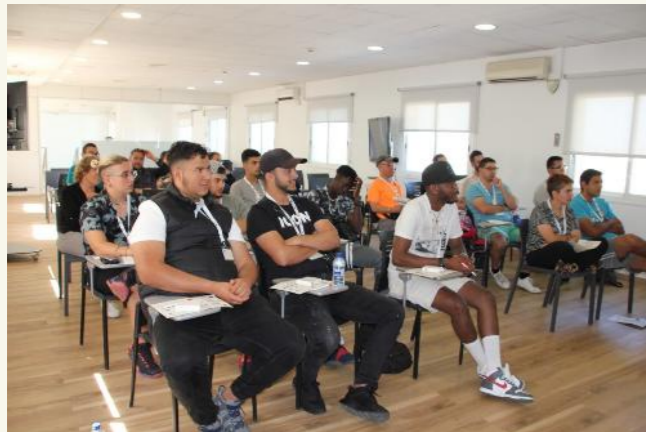
Visita a les instal·lacions de Vopak Terquimsa.