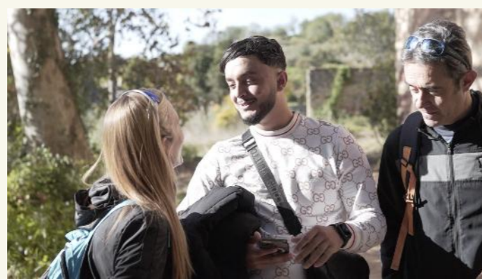
Trobada grupal. Descuberta del municipi del Catllar.

El seguiment de la mentoria social s'ha dut a terme per part de l'equip tècnic a partir de diferents activitats: recollint dades sobre les trobades individuals de les parelles, fent seguiment amb les persones joves i mentors/es en funció de les necessitats detectades, facilitant suport i orientació, vetllant per les relacions, realitzant trobades grupals i avaluant l'evolució del programa mitjançant qüestionaris de seguiment i entrevistes de tancament.