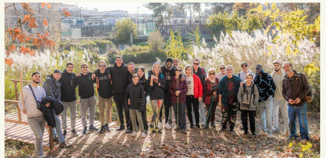
Trobada grupal. Descuberta del municipi del Catllar.

El desenvolupament d'accions formatives relacionades amb el món laboral, les quals han estat complementàries a les pròpies que desenvolupa la Fundació Onada, tals com les competències bàsiques, tècniques i transversals necessàries per ocupar qualsevol lloc de treball.