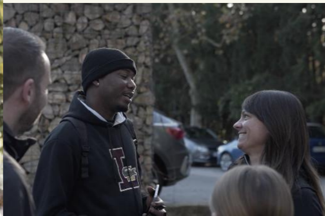
Trobada grupal. Descoberta del municipi del Catllar.