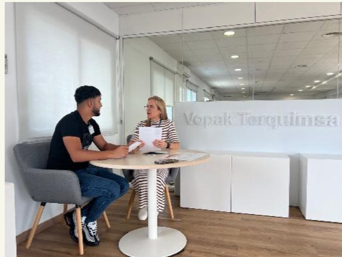
Mòdul formatiu "Recerca de Feina", simulació d'entrevistes.