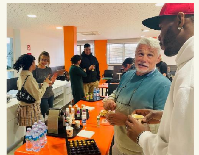
Trobada grupal de presentació de parelles de la mentoria social.

En el context d'acompanyament i suport que oferim als/les joves en els seus processos d'inserció sociolaboral i malgrat els acords prèviament establerts, de vegades, degut a canvis no sempre previsibles, cal modificar els itineraris pactats, revisar-los o adaptar-los. En ocasions les persones decideixen deixar de participar, desvinculant-se de l'entorn, com ha passat en tres de les persones joves participants.