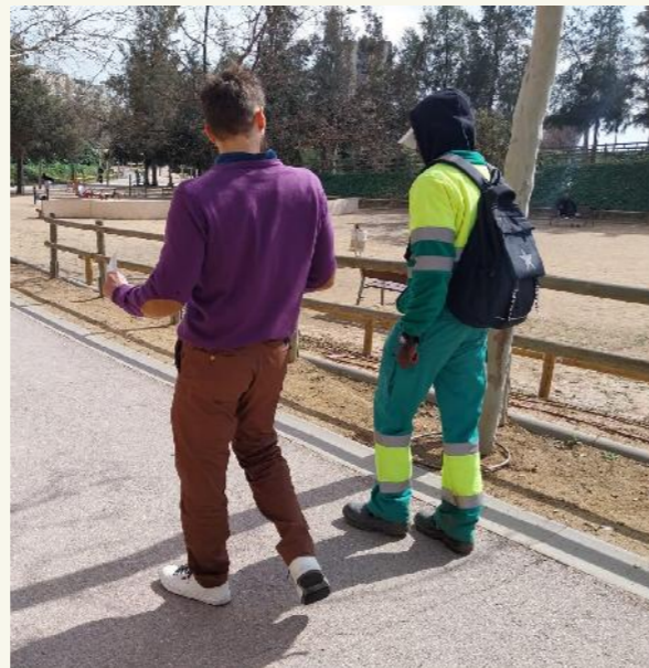
Trobada individual de presentació.

El col·lectiu al qual s'ha adreçat el programa ha estat el de joves que han viscut part de la seva vida sota la tutela de l'Administració a causa de la pèrdua de lligams familiars o dels processos de migració, joves que arriben a la seva majoria d'edat amb un bagatge vital complex i una emancipació prematura i forçada. Justament és en aquest moment que molts han d'afrontar aquest nou moment vital sense comptar amb la maduresa, els recursos econòmics ni els suports familiars necessaris per afrontar la seva transició a la vida adulta amb suficients garanties per assolir una plena integració social.