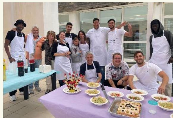
Aula Culinària F. Onada. Trobada MasterChef.