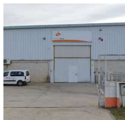
RIU CLAR (exterior de la nau)