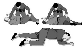
POSICIÓ DE SEGURETAT