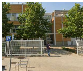
TARRAGONA (exterior edifici)